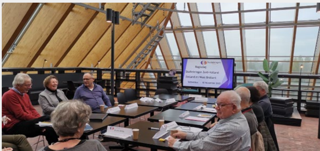
Kringen en platformbestuur op 18 november bijeen in Spijkenisse

Een van de manieren waarop het Platformbestuur het contact met de studiekringen onderhoudt zijn regionale ontmoetingsdagen. In de vorige nieuwsbrief lieten we weten dat in oktober een aantal kringen in Noord-Holland bij elkaar is geweest, in november zaten kringen in Zuidwest-Nederland bij elkaar.