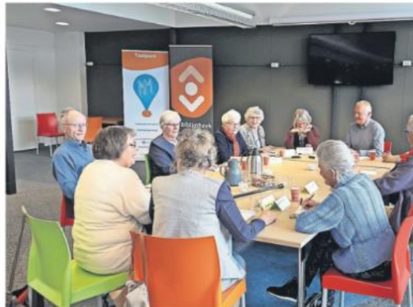
Infotiebijeenkomst van een op te richten studiekring in Twello.

"Het leuke is namelijk dat je elkaar stimuleert en dat het je brein prikkel. Met het oplossen van sudoku's, kruiswoordpuzzels en cryptogrammen doe je dat ook wel, maar dit is